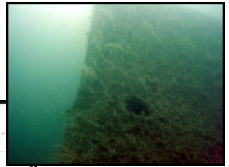
La proue retournée