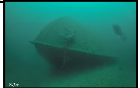
Canon de 88mm