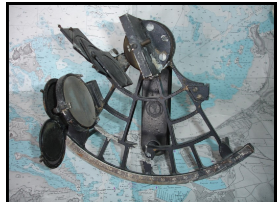
Sextant retrouvé sur l'épave